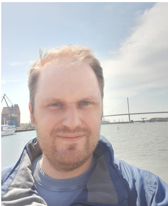
Vorwort des Vorsitzenden der Deutschen Schachjugend e.V.

Für die Deutsche Schachjugend ist die Einhaltung von Fair Play eine der wichtigsten Ziele überhaupt.