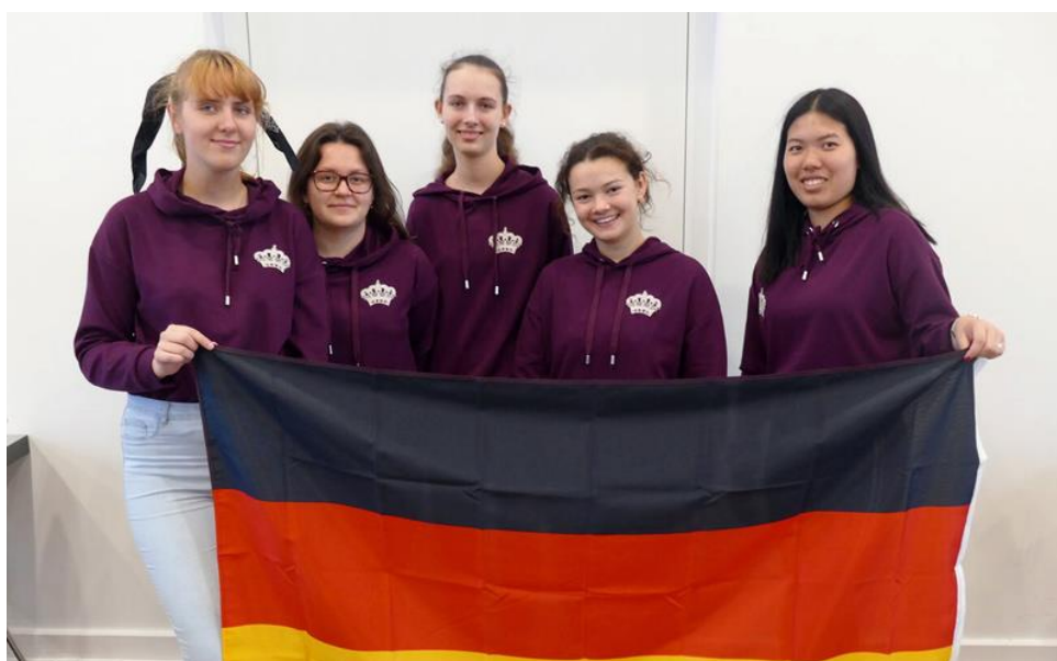
Deutscher Meister WK M 2019 Kant-Gymnasium Karlsruhe